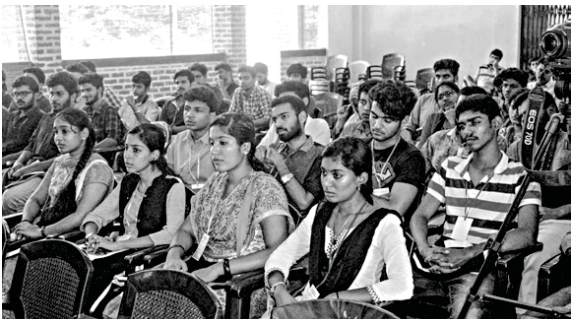
മീറ്റിൽ പങ്കെടുക്കുന്ന എത്തിനിയറിംഗ് വിദ്യാർത്ഥികൾ