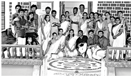
ഐ.ആർ.ടി.സി പ്രവർത്തകർ ഒരുകീയ പൂക്കളം

ഐ.ആർ.ടി.സി കാമ്പസിലെ ഓണാഘോഷം സെപ്തംബർ 1 ന് വിപുലമായി ആഘോഷിച്ചു. ഐ.ആർ.ടി.സി പ്രവർത്തകർ എല്ലാവരും ആഘോഷത്തിൽ പങ്കുചേർന്നു. രാവിലെ 8 മണി മുതൽ പൂക്കളമിടൽ ആരംഭിച്ചു. അതിനുശേഷം ഓണക്കളികൾ ആരംഭിച്ചു. ഉച്ചയ്ക്ക് സമൃദ്ധമായ ഓണസദ്യയുടെ ഓണാഘോഷം സമാപിച്ചു.