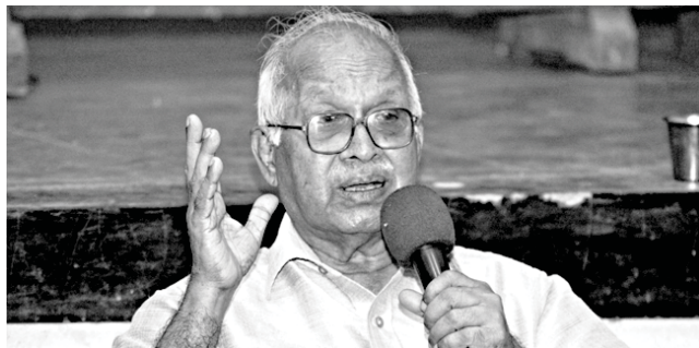
ഡോ.എം.പി പരമേശ്വരൻ ഉദ്ഘാടനം ചെയ്യുന്നു

മാലിന്യസംസ്കരണം: 100 പഞ്ചായത്തുകൾ പൂർത്തിയായി