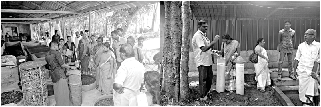
ജനപ്രതിനിധികളും ഉദ്യോഗസ്ഥരും പ്രായോഗിക പരിശീലനത്തിലേർപ്പെടുന്നു

മാലിന്യസംസ്കരണത്തിൽ ഐ.ആർ.ടി.സി നടത്തിവരുന്ന ശ്രിദിന പരിശീലന പരമ്പരയിൽ കേരളത്തിലെ 100 പഞ്ചായത്തുകളിലെയും മറ്റ് തദ്ദേശസ്വയംഭരണ സ്ഥാപനങ്ങളിലെയും ജനപ്രതിനിധികളും ഉദ്യോഗസ്ഥരും പങ്കാളികളായി. മാലിന്യ പരിപാലന പ്രവർത്തനങ്ങൾ ഫലപ്രദമായി നടപ്പാക്കുന്നതിന് വേണ്ടി സർക്കാർ ഉത്തരവിലൂടെ ഐ.ആർ.ടി.സിയെ ചുമതലപ്പെടുത്തിയ പശ്ചാത്തലത്തിലാണ് പരിശീലന പരമ്പര സംഘടിപ്പിച്ചത്. ഇതുവരെ 9 ബാച്ചുകളുടെ പരിശീലനം പൂർത്തിയായി. ഓരോ ബാച്ചിലും ശരാശരി 10 പഞ്ചായത്തുകൾ വീതം പങ്കെടുത്തു.